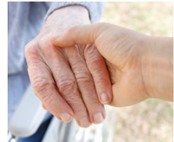
ACCOMPAGNEMENT DE LA PERSONNE ÂGÉE ET DES AIDANTS

Les formations à destination des membres du comité de direction élargi et des équipes pluridisciplinaires sont différentes bien qu'ayant les mêmes objectifs pédagogiques