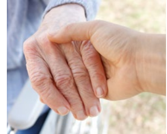
ACCOMPAGNEMENT DE LA PERSONNE ÂGÉE ET DES AIDANTS

Accompagnement en EHPAD et/ou « à domicile »