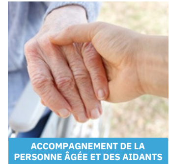
ACCOMPAGNEMENT DE LA PERSONNE ÂGÉE ET DES AIDANTS

Accompagnement en EHPAD et/ou « à domicile »