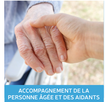
ACCOMPAGNEMENT DE LA PERSONNE ÂGÉE ET DES AIDANTS

Orientation : maladies chroniques, perte d'autonomie, intervention des aidants