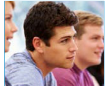
ENSEIGNER EN SECTEUR MÉDICAL & PARAMÉDICAL

Orientation : Élaborer, animer et évaluer des séquences pédagogiques auprès d'un groupe d'étudiants ou d'adultes en formation dans le secteur médical.