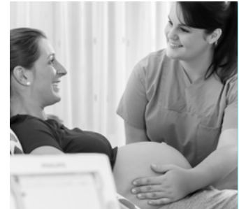
GROSSESSE & POST PARTUM

Orientation : Accompagnement et prise en charge de la patiente dans le cadre d'une PMA.