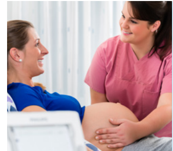
GROSSESSE & POST PARTUM