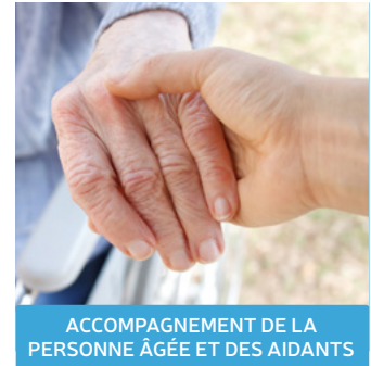
ACCOMPAGNEMENT DE LA PERSONNE ÂGÉE ET DES AIDANTS

Orientation : maladies chroniques, perte d'autonomie, intervention des aidants